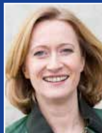
Kerstin Andreae MdB, Stellv. Fraktionsvorsitzende Bündnis 90/Die Grünen