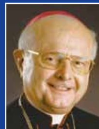
Erzbischof Dr. Zollitsch Vorsitzender der Deutschen Bischöfenskonferenz